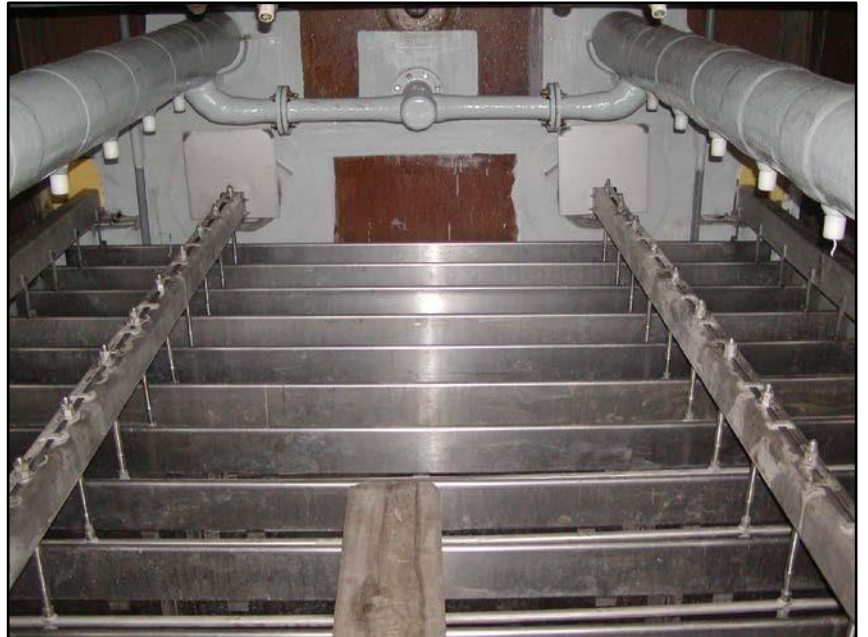
Sobre la base de nuestra experiencia, B&W supervisa continuamente los resultados de las unidades operativas y lleva a cabo una amplia investigación para optimizar el rendimiento del ESP en mojado.

Monitoreado anualmente para proporcionar datos útiles para avanzar en el desarrollo de esta tecnología. La investigación y las pruebas continúan a través de nuestras instalaciones de investigación y desarrollo y en los sitios de prueba de anfitriones comerciales.